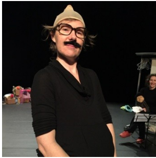
essais pour le Maître d'école

Les comédiennes prendront en charge tous les personnages grâce à des subterfuges, masques, postiches et accessoires. Comme un manège sur lequel elles monteraient et elles choisiraient leurs rôles. Ce doit être ludique aussi bien à mettre en œuvre qu'à regarder.