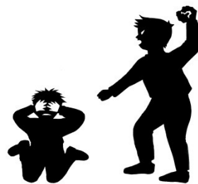
croquis préparatoires théâtre d'ombres