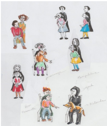
croquis préparatoires marionnettes

Kalouche et Rosa sont inséparables, comme les doigts de la main, comme une seule femme, ne font qu'une. Il apparaît simple de traiter ces personnages par le biais de la marionnette ; à la fois doudou, et son amie imaginaire, pétillante, Kalouche est la conscience, la voix par laquelle Rosa va se libérer.