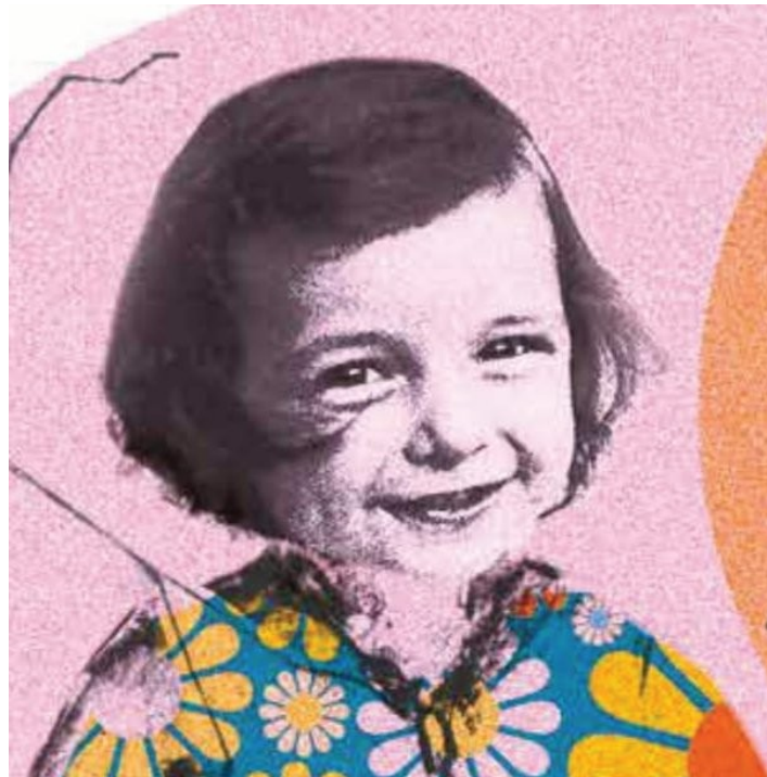
ESSAI VISUEL AFFICHE ROSA