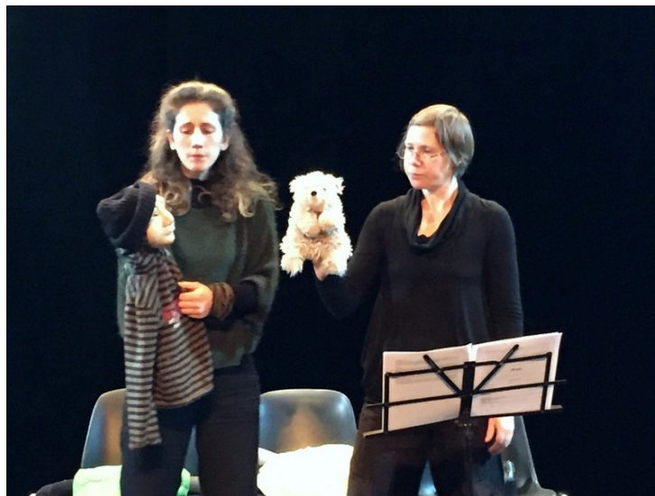
Tentative au plateau, 1 ère résidence décembre 2022

Au moment des résidences de création en immersion dans les villes et villages, nous développerons l'aspect participatif avec les habitant-e-s en ouvrant au public les répétitions et les sorties de résidence. Nous mettrons en place des ateliers de pratiques artistiques. Nous avons pour dessein de nous installer sur des territoires ayant une école, un collège ou un lycée. Nous impliquerons les habitant-e-s de tous âges et de milieux sociaux confondus.